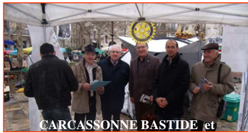
CARCASSONNE BASTIDE et CARCASSONNE (doyen) font leur marché